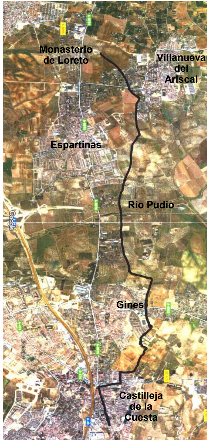
MAPA DEL RECORRIDO

Castilleja: Calle Real, Plácido Fernández Viagas, Camino Cortijuelo Alto. Gines: Camino Cotijuelo Alto, La Cañada, Avda. de la Petanca, Glorieta de la calle Virgen del Pilar, Camino del Cristiano, Camino Gines-Villanueva del Ariscal. Espartinas: Camino de Gines, Camino de Loreto. Monasterio de Loreto.